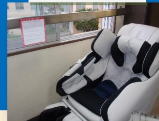
マッサージチェア